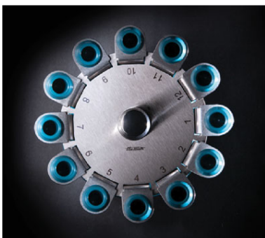
Арт. 1142. 12-местный горизонтальный ротор