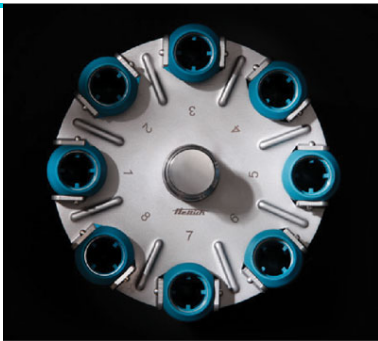
Арт. 1148. 8-местный горизонтальный ротор