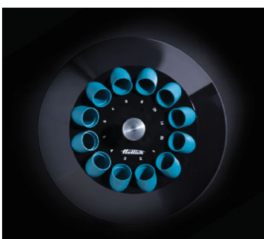
Арт. 1139. 12-местный угловой ротор