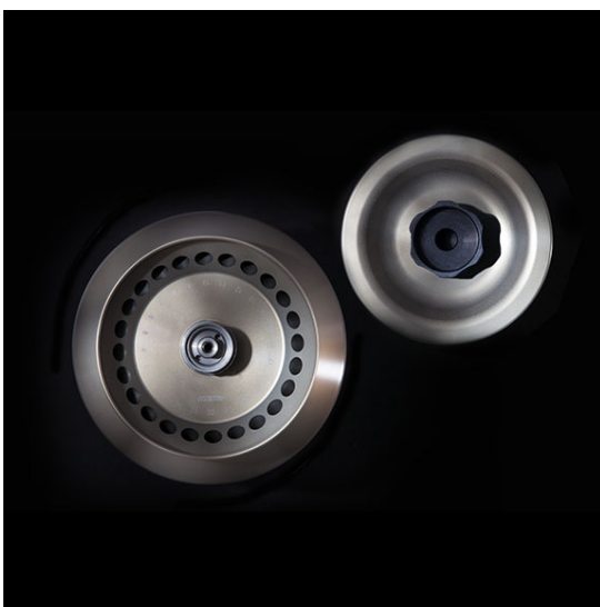
Арт. 2428. 24-местный угловой ротор