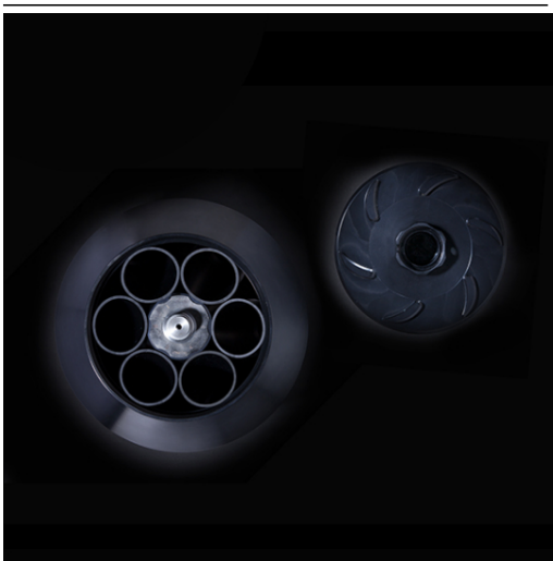
Арт. 4282. 6-местный угловой ротор